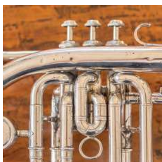
ventielen van een corhoorn