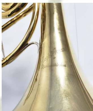
logo Knopf waldhoorn